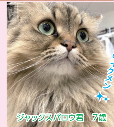
ジャックスパロウ君 7歳