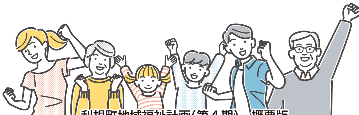
利根町地域福祉計画(第4期) 概要版