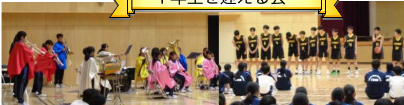
【どの部活動も工夫を凝らした部活動紹介をしていました】