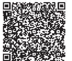
いばらき電子申請届出サービス

特別な事情により、上記による登録ができない場合には、下記「ふれ愛タクシー予約センター」への電話での利用登録も受け付けています。（登録後、実際に利用する際は、お電話でその都度予約していただくようになります。）ご利用方法などご不明な点についても、予約センターまでお気軽にお問い合わせください。