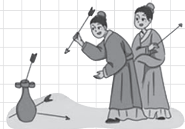
投壺（とうこ）：壺に矢を投げ入れる遊び