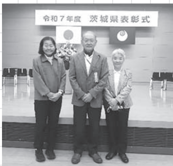
令和7年度茨城県功績者表彰式

明けましておめでとういねくらぶ 日頃、運動集会にご参加いただいている皆さま、そして新たに参加をお考えの皆さま、本年もどうぞよろしくお願い申し上げます。 昨年11月「利根フリフリクラブ」は、令和7年度茨城県表彰式において、功績者表彰（団体）を拝受いたしました。「多年にわたり運動集会を開催し、町民の忘れ予防のため運動を推進し、地域住民の健康増進に貢献した」ことが認められたものです。 これはひとえに、日々皆さまにフリフリ運動集会にご参加いただいた賜物であることは、言うまでもありません。改めて感謝を申し上げます次第です。 さて、本年は「午年」です。「エネルギーで活発な年」とされているようです。 本年も皆さまと共に、運動集会を通じ、明るく健康で元気な1年にしていきたいと思います。「継続は力なり！」 （利根フリフリクラブ 市川）