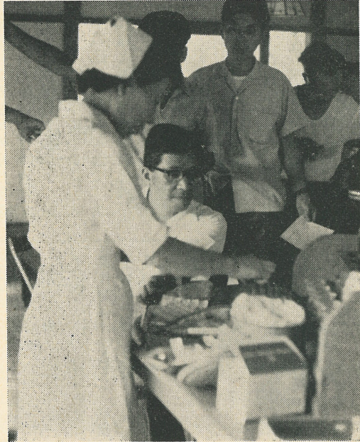
写真は8月26日の献血。採血前にまず血液の比重をはかる。