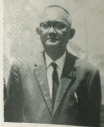
利根町商工会会長