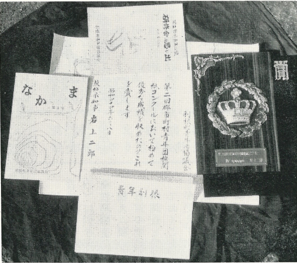
写真は機関紙なかま、表彰状、記念のため、研修会の思い出、青年利根。

交流会が行なわれました。このスポーツ交流会は、青年会の呼びかけで、町内のいくつかの団体が集まって行なわれたものです。午前中のバレーボールの試合には、14チームが参加し、決勝戦は婦人会選抜チームと役場チームで行なわれ、熱戦の末、役場チームが第一位となりました。午後は昼食ののち、歌やフォークダンスなどのレクリエーション。続いて四つの分科会に分かれて話し合い。さらに全体会が行なわれ、四時過ぎに閉会。