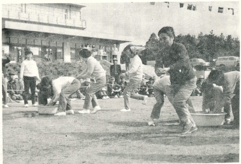
安来節と題する競技です。たらいの中のどじょうがなかなかつかまりません。三位までの入賞者にはそれぞれの賞品がおくられました。