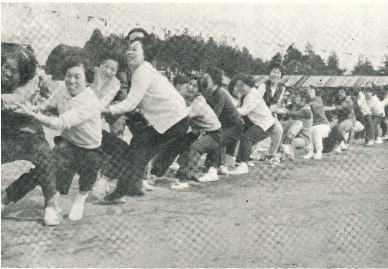
つなひきは文、布川チーム対文間、東文間チーム各40人ずつで行なわれ、三回勝負の結果、後者に軍配が上りました。