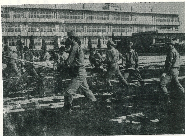
写真は雪解けの校庭で行なわれた ポンプ操法