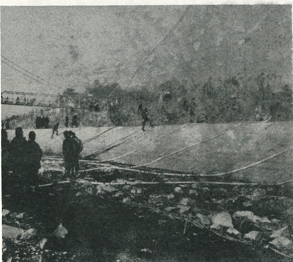
写真は利根川で行なわれた いっせい防水