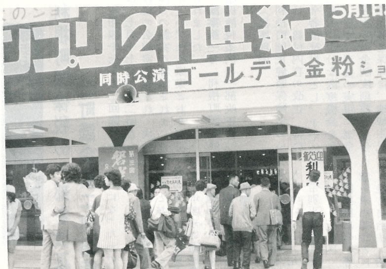
▲佐貫駅を出発して6時間。いよいよ待望の磐梯グランドホテルに到着です。