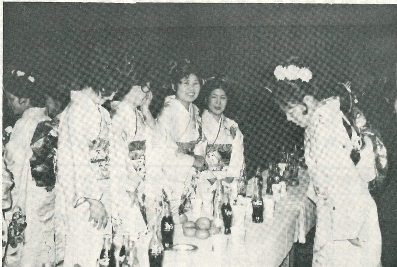
ことしの成人式は利根中学校の体育館で行なわれました。