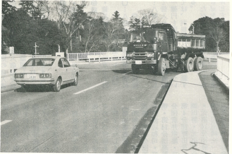
県道竜ヶ崎～千葉線で最近交通事故が続出しております。お互いに気をつけましょう。写真は栄橋の交差点です。このほど信号機が設置されました。

問 小学校には体育館がないが、将来新設する考えがあるかどうか。体位の向上が重要視されている現在、速急にはなくてもよいからぜひとも町の執行部のかたのお考えをお伺いしたい。