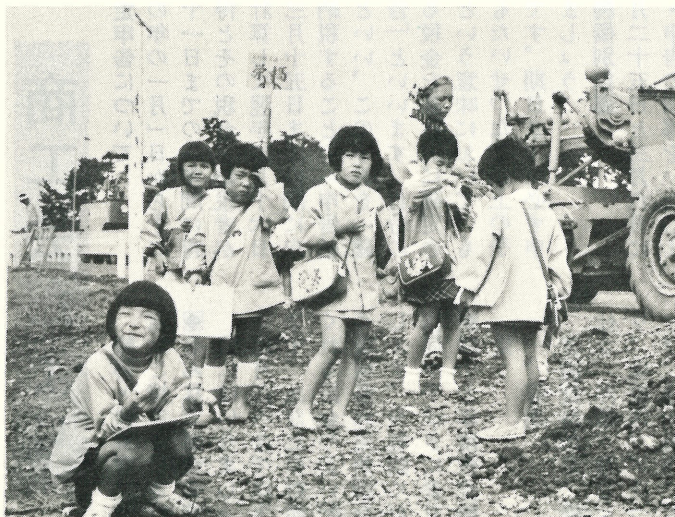
写真は栄橋で帰りのバスを待つ布川保育園のヨイ子たちです。