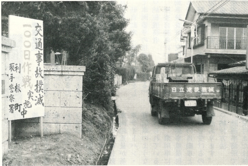
運転者は法規を守り、歩行者もまた安全な歩行方法をとることがたいせつです。

者多発県となつてしまいました。開発途上にある本県の実勢からみて、交通事故の増加を抑止するためには、取締力の強化、安全施設の充実など、今後抜本的な改善をさらに推