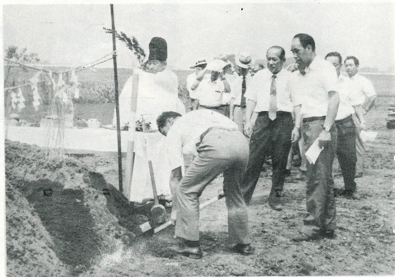
▲ 写真は7月17日羽根野地先きで行なわれた産業道路の地鎮祭です。一日も早い完成が待たれます。

は、宅地等に係る固定資産税について、現行の負担調整措置に伴って生じている税負担の不均衡を是正し、課税の適正化を図るため、住宅用地について、その課税を1.2とする軽減を行なうとともに、昭和四十八年度及び四十九年度において激変を緩和するため措置を講じつつ、評価額に基づいて課税を行なうこと。