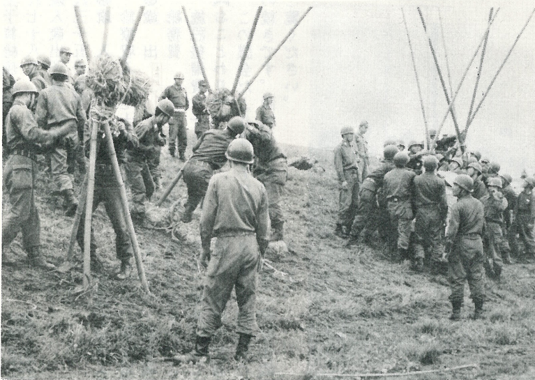
▲ いよよ台風シーズンです。万が一にそなえて、まわりにおきよう。写真は、6月28日利根川で行なわれた水防訓練。

○議案第十号 文小学校校庭埋立工事請負契約について 昭和四十八年六月二十五日 利根町契約条例第二条の規定に基づき、随意請負契約に付した文小学校校庭埋立工事について、後記のとおり請負契約を締結するため、地方自治法第九十六条第一項第五号の規定によって議会の議決を求める。