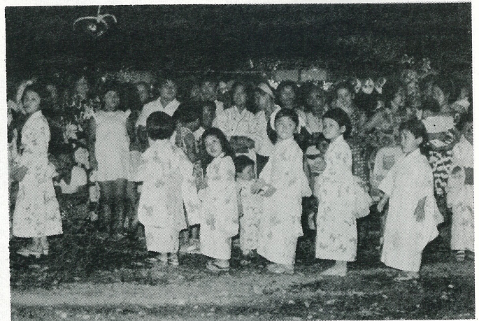
夏休みの思い出 夏休み中町内各地で、祭りや盆踊りなどが行なわれました。写真は8月17日徳満寺下で撮影したのですが、この晩花火と同時に利根川の流燈は、NHKテレビでも放映されました。— みんな楽しかった夏休みの思い出です