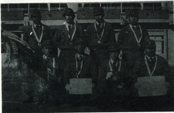
▲写真は自動車ポンプの部で優勝した第1分団(内宿・浜宿・押付本田)のチームです。