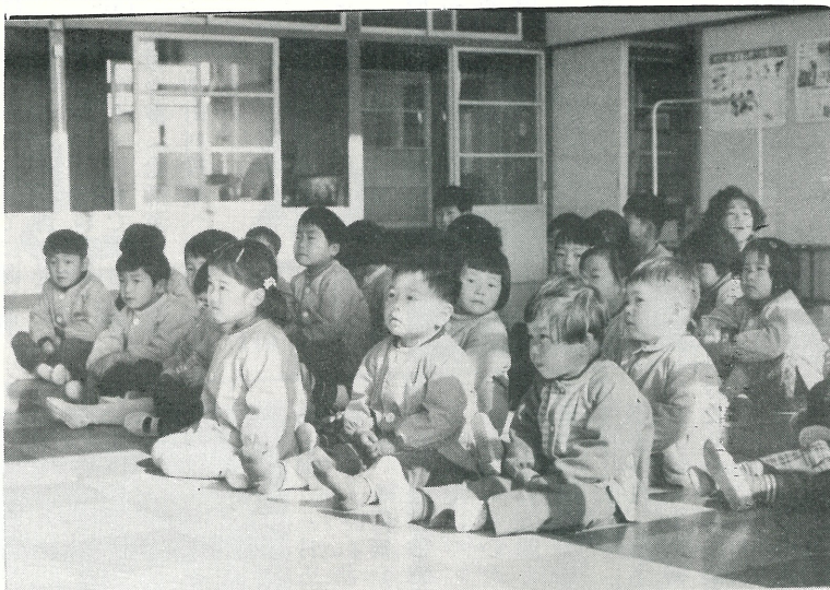
▲写真は東文間保育園の児童たち 11月24日写す