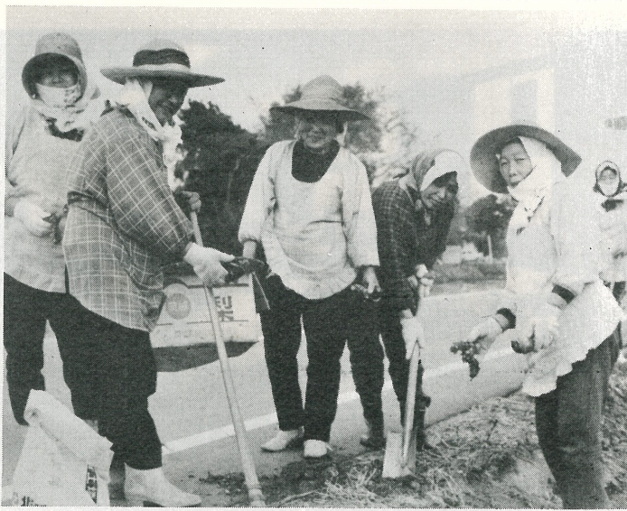
▲写真は美しい花の咲く日を待ちわびながらバイパスにカンナを植付ける大房地区の皆さんです。4月15日写す。