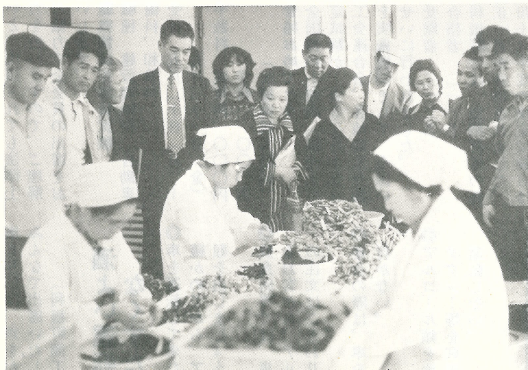
▲ 4月26日大字大房の中央軒フーズ(せんべい工場)を視察する町政モニターの皆さん。会社の係りのかたからくわしく説明を聞きながら、一通り見学したのち、作りたてのせんべいでお茶をごちそうになりました。

日時 5月27日(月) 午前10時～午後3時 場所 利根町公会堂 相談 土地、家屋、結婚、相続、親子、交通事故、公害、民事刑事に関する問題、その他お困りのこと。 担当者 法務局担当者、人権擁護委員