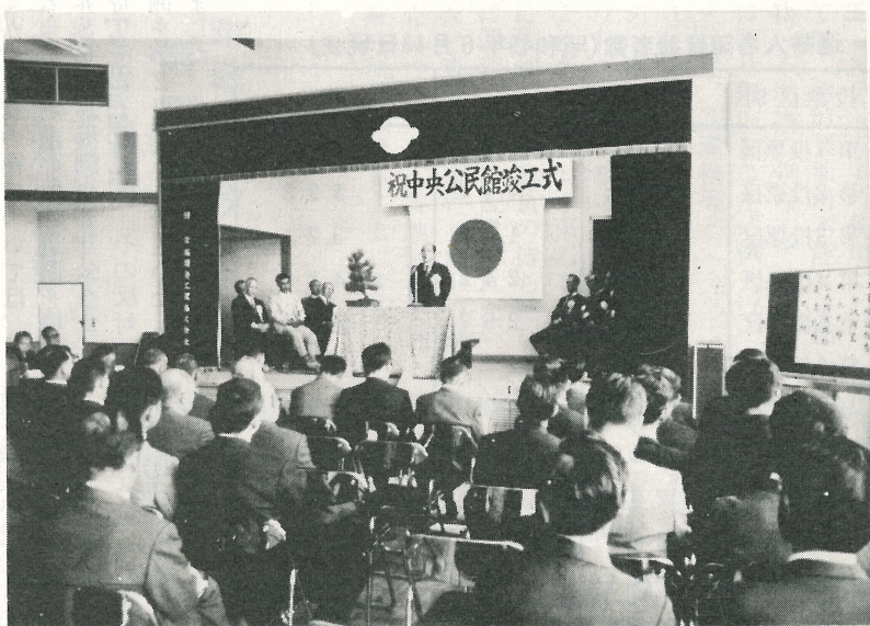
▲ 中央公民館竣工式