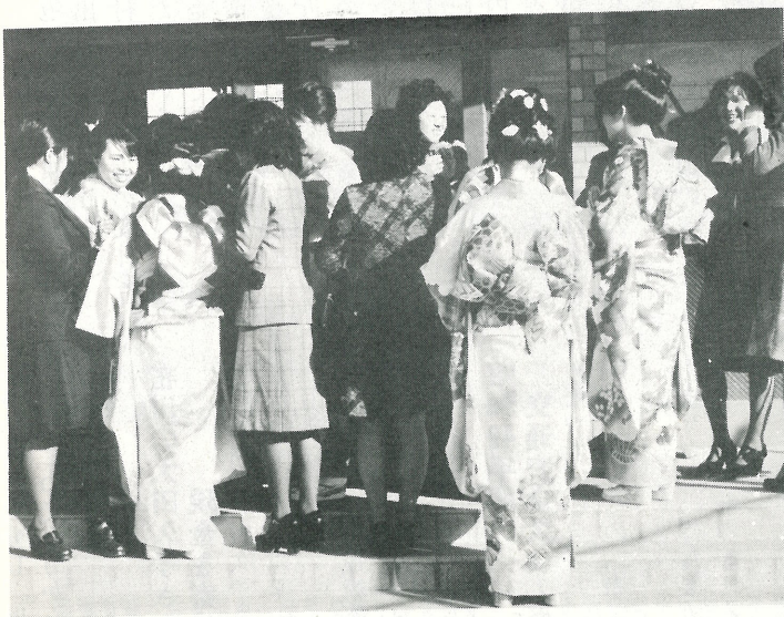
▲ 女子成人者の洋装も年々ふえ、本年度は20名を数えました。

将来をになう青年男女の前途 を祝福いたしました。 成人いたしますと、選挙権 をはじめいろいろな権利を獲 得いたしますが、ことしはさ つそく夏に参議院議員、年末 に県議会議員の選挙が執行さ れますので、一票の重みを十 分認識し、棄権などは絶対し ないよう心がけましょう。