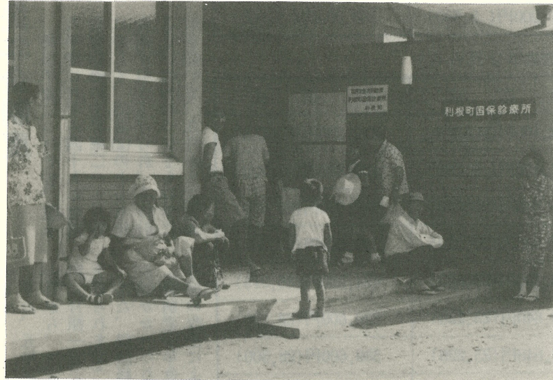
▲診療開始前から順番を待つ患者さん 8月11日 国保診療所にて