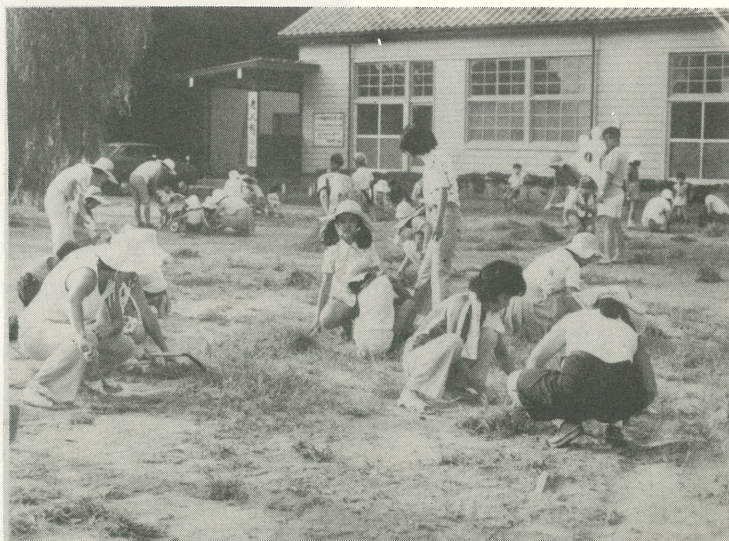
▲親子そろって憩いの家の草取りにはげむ白鷺の街の皆さん