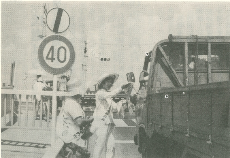
▲交通安全三角旗を配りながら安全運転を呼びかける母の会の皆さん

民運動期間中は、町の交通安全協会、同じく母の会、交通指導隊のご協力によって、安全施設の清掃、整備、交通安全三角旗の配付等が行われました。 炎暑の折、まことにご苦労さまでした。