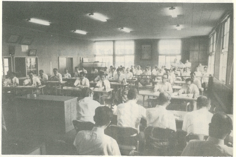
▲第3回臨時会は、多数の傍聴人が見守る中で審議が行われた。

ないよう、常に公正を旨とし責任ある行動をとるべき義務があり、町民の公僕として、また、町民のよき指導者でもあるべきところであります。