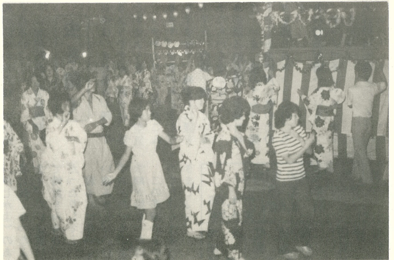
▲夏の夜に拾う … 8月15日大字立木の円明寺 境内で恒例の盆踊り大会が行われました。

○台風のとなどで電線が切れ、たれ下がっているときは、これにさわつたり近よることは危険です。 ○電線がキケンなときは、お