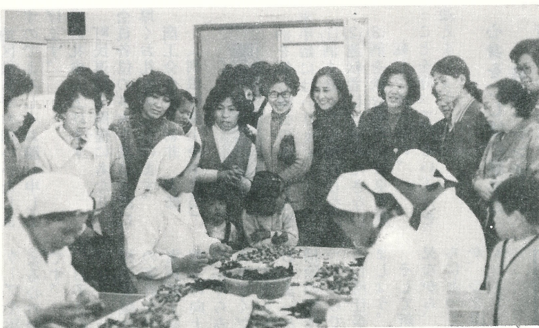
▲ 11月14日、白鷺の街の主婦の皆さんが2台のマイクロバスに分乗して、町内の主要公共施設や開発状況の視察を行いました。写真は、その時中央軒フーズで撮ったものです。