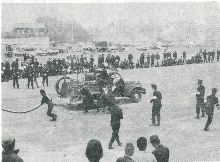
▲ 操法競技はこのようにして行われます。

第八回利根町消防ポンプ操法競技大会は、十一月十七日利根中学校で盛大に挙行され、後記のとおり入賞が決定いたしました。 この大会も、回を重ねるにつれて、各分団とも優秀な成績を挙げ、この日優勝した第一分団及び第四分団は、十一月二十四日、藤代町で開催された。 なお、この日優勝した第一分団及び第四分団は、十一月二十四日、藤代町で開催された。 の差はほとんどなく、県消防学校から来町した審判長から賞讃の言葉をいただきました。