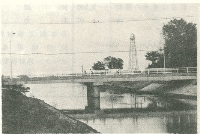
万歳橋竣工 新利根川の万歳橋が永久橋に生まれかわりました。利根町の東端から河内村を通って竜ヶ崎市方面へ行くのに重要な役割を果たしています。5月2日竣工。利根町簡易水道のタンクも写っています。

点を十分考えて、それを排除しながら農業振興のためのいろいろの方策を考えて行きたい。