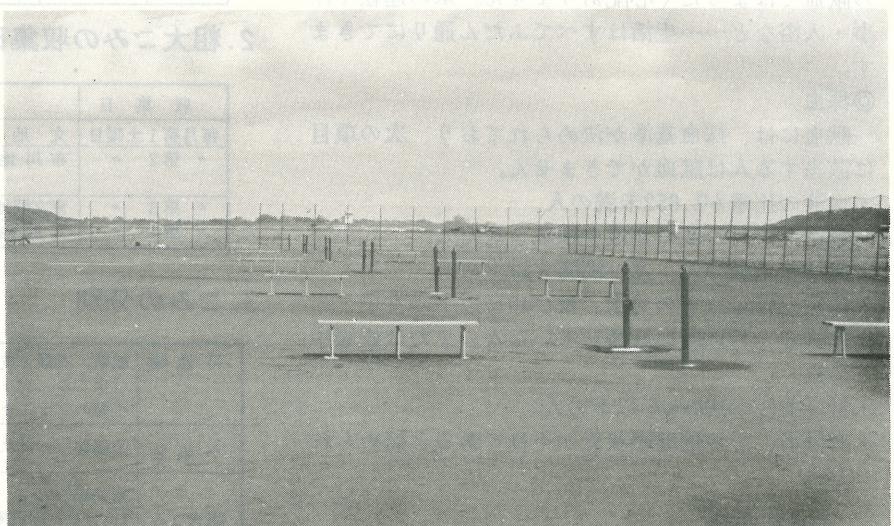
▲大字布川地先の利根川河川敷に建設中のテニスコートがこの程完成しました。 使用できるのは7月頃になる予定です