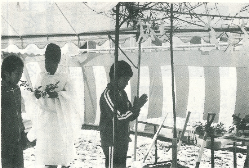
▲5月1日午前11時から、現場で行われた文小学校の起工式には、同校の児童代表も玉ぐしをささげ、立派な校舎の完成をお祈りしました。

同校給食室は、六社による指名競争入札の結果、五千七百十万円が地元の常総開発工業(株)が落札、施工と決定しました。 工期は、四月二十六日から十月二十七日までの一七〇日間、建築面積は二七二平方メートルで、最新の給食施設を整備するものです。