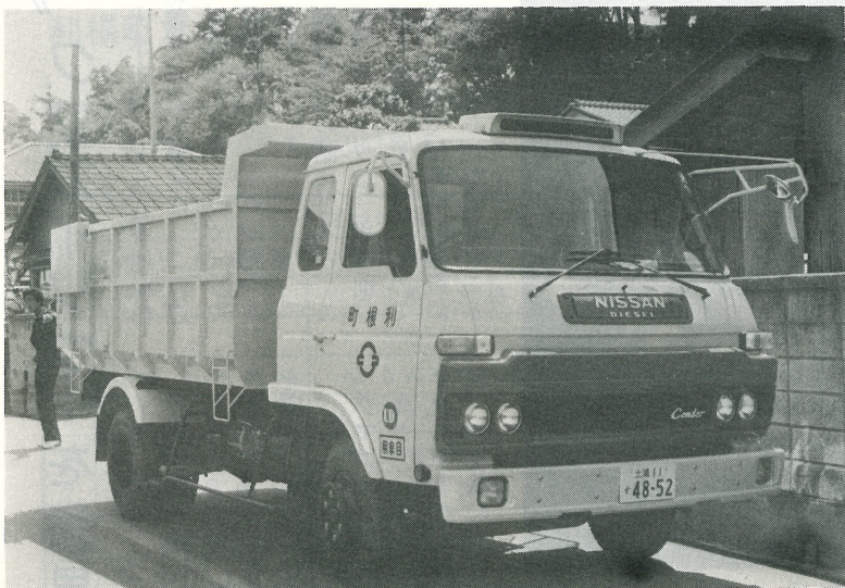
▲写真は、この程町で購入した4t車。 6月2日(月)から、収集日を変更されますので、注意して出すようお願いします。

ごみの収集につきましては、みなさんの御協力により円滑にすすんでまいりましたが、人口の急増に伴いごみの量も増加しており、収集困難な地域も出て来ています。このため、町では現在使用している収集車よりも大きい四トン車を一台購入しました。 つきましては、来る六月二日(月)から収集日を変更させていただきますので、よろしく御配慮願います。 なお、新しい収集日は別表のとおりですが、決められた日に決められた容器で決められた場所へ出すようお願いいたします。