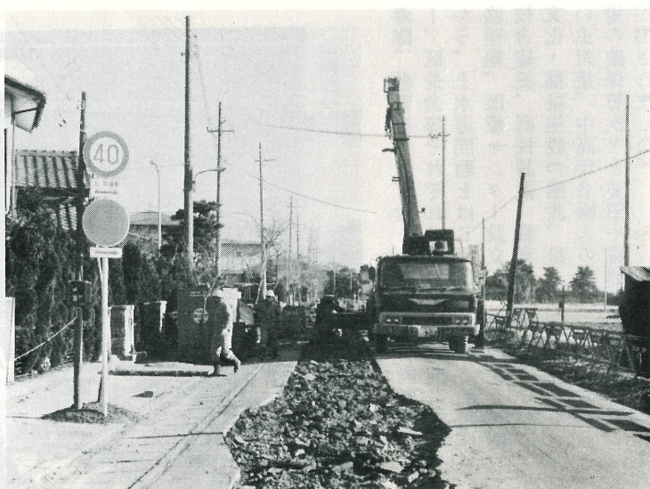
▲ 白鷺団地前の公共下水道建設工事。 住民の皆様にはご迷惑をおかけしております が、ご協力をお願いします。