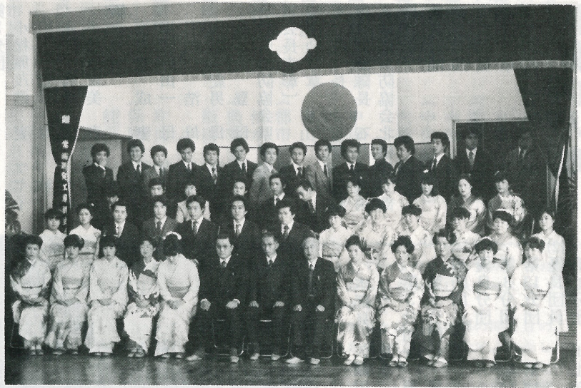
▲ 文間・東文間地区の成人者 1月15日 中央公民館で撮影

独立した社会人として最も重要なものは、選挙権で、これによって国民として国政に地方自治に参加する資格が与えられますし、財産や身分についても今までの法律上の保護が取り除かれ、独立の社会人としての自らの判断と責任