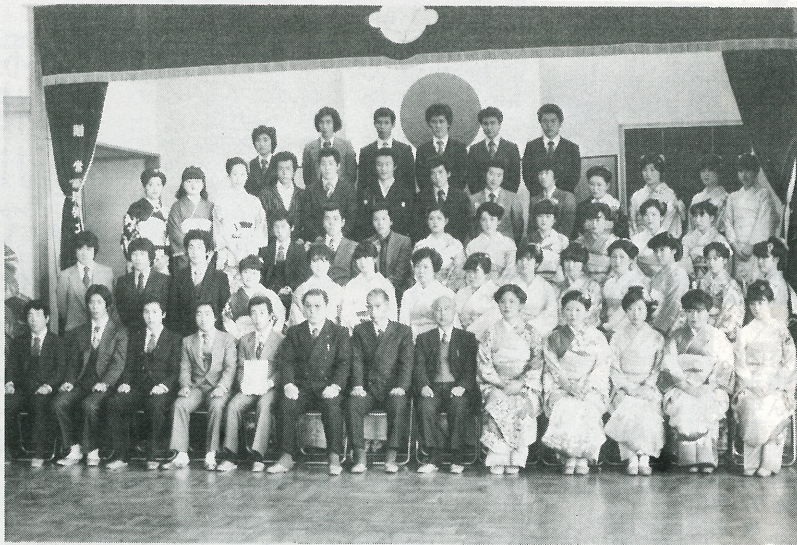
▲ 新しく成人となられた皆さんおめでとうございます。 文・布川地区の成人者

町では一月十五日午前十時から、中央公民館で成人式を挙行し、社会人としての新しい門出を祝福いたしました。