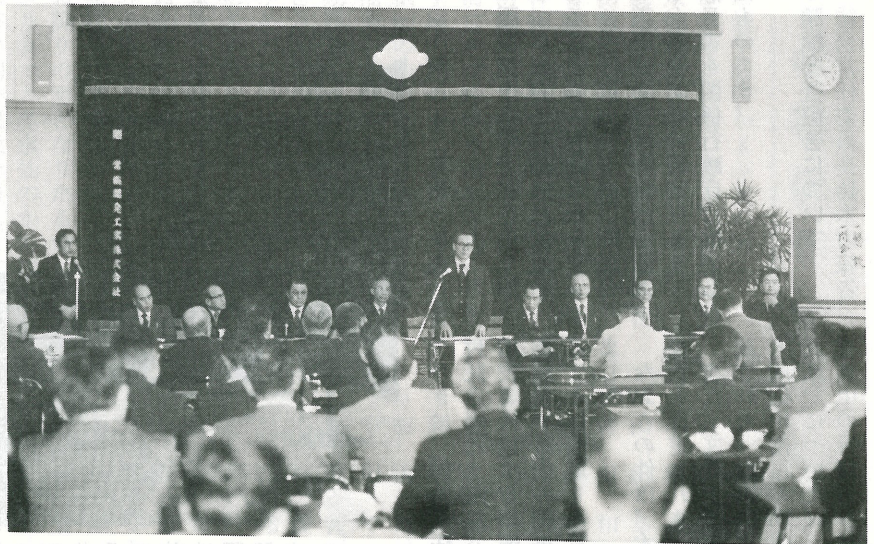
▲ 1月19日、中央公民館で行われた知事との 対話集会。