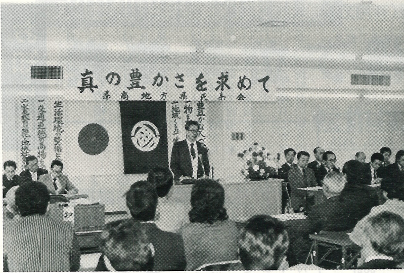
▲ 2月25日、谷田部町役場で開催された 県民集会全体集会で、所見を述べる竹 内知事。

地区と竜ヶ崎地区の二つに分かれ、利根町は竜ヶ崎地区に属しています。竜ヶ崎地区県民集会では、①交通道德の高揚を図るためには、②家庭教育の強化と地域社会の浄化を図るためには、以上二つの問題について討論、実践がなされてきました。