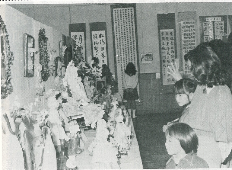
▲ 11月2日、3日「第2回利根町文化祭」が今年も盛大に開催されました。写真は第2会場中央公民館で、出品された作品を鑑賞している方々。