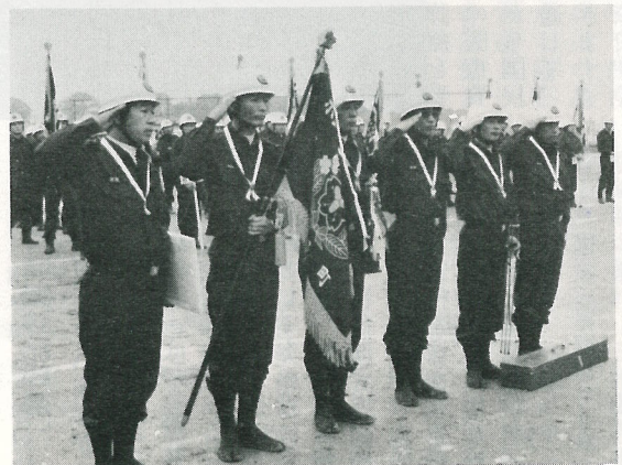
▼ 自動車ポンプの部優勝の第14分団