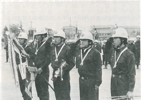
▲ 可搬式ポンプの部優勝の第3分団