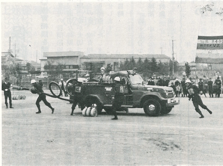
▲ 11月3日利根中学校グラウンドで行われた操法大会の実際。

各分団とも日頃の訓練の成果を遺憾なく発揮し、優秀のつげがたい演技が繰り広げられました。 しかし、厳正な審判の結果僅少の差で次のとおり入賞が決まりました。