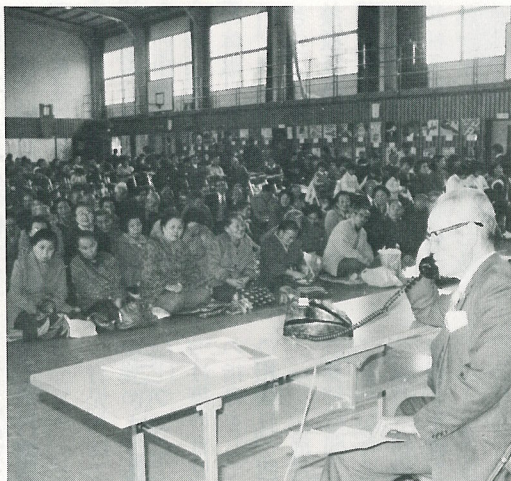
▲「110番のかけ方コーナー」では、種々の事件を想定し、実際に警察官との対応を学びました。