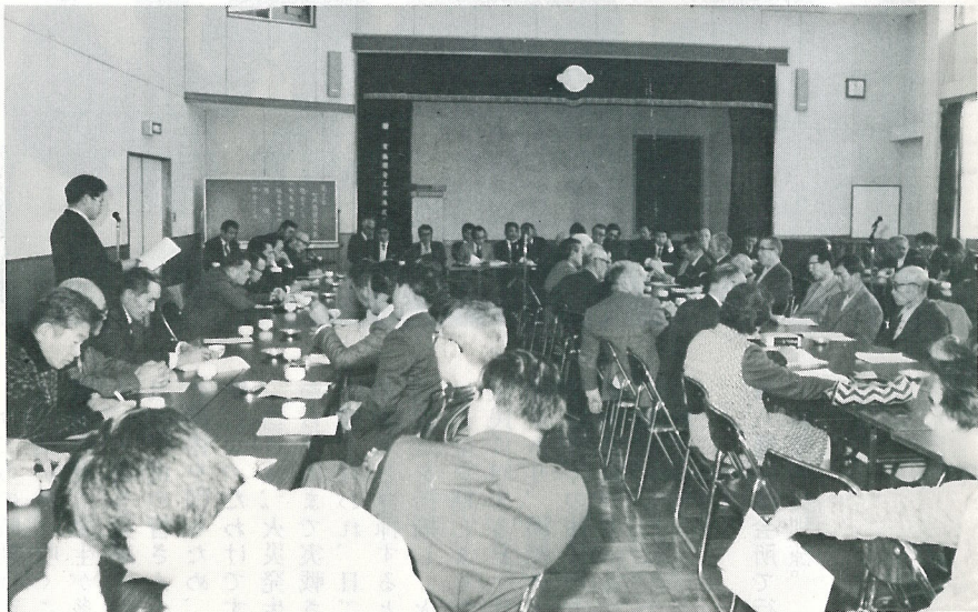
▲ 1月18日、中央公民館で行われた第11回町政懇談会。