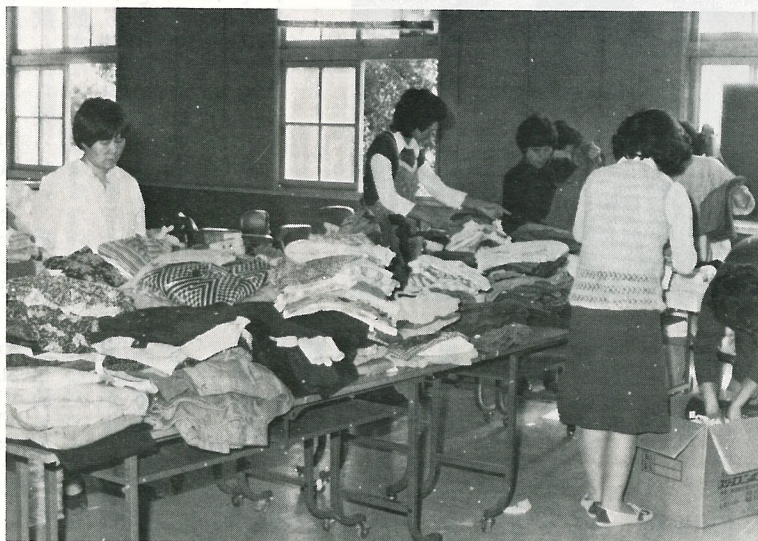
▲ 救援物資の荷造りをするボランティアの方々。(10月22日、役場会議室)