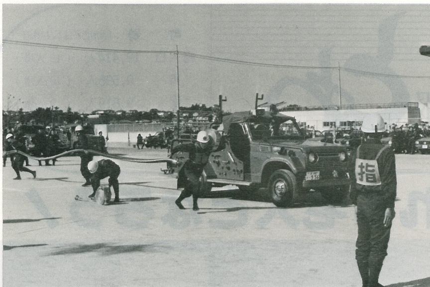
▲ 10月30日、文小學校グラウンドで消防ポンプ操法競技大会が開催されました。

当日は、可搬式ポンプの部に11分団、自動車ポンプの部に8分団が出場し、日頃の訓練の成果を遺憾なく発揮し、