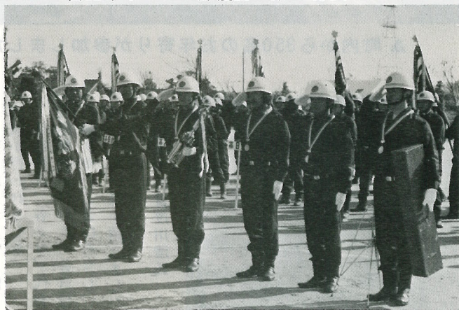
▼ 自動車ポンプの部優勝の第1分団

優劣のつけがたい演技が繰り広げられました。しかし、厳正な審査の結果次のとおり入賞が決まりました。