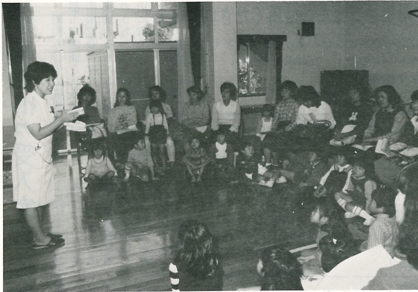
▲ 去る10月20日、保健センターで母と子の歯みがき指導教室が開催されました。

正しい歯みがき方の指導を行い、希望者にはフッ素の塗布を行ったものです。申し込みが三八〇名と殺到し、当日実施者が三二九名で大盛況でした。