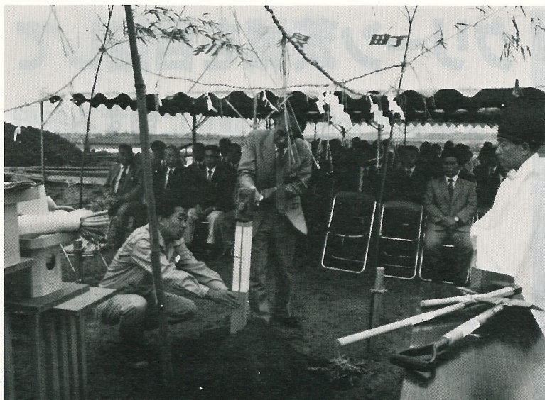
▲ 去る10月14日、(仮称)太子堂小学校新築工事の起工式が行われました。

委員の任命について等六件の議案が審議され、すべて原案どおり可決(同意)されました。議会の概要は、次のとおりです。 ◎下水道特別会計予算を補正 昭和五十八年度利根町下水道事業特別会計予算に、二百五十万円を追加し、予算総額が十億一千九百一十一万円となりました。 ◎雨水幹線工事請負契約を締結 第四一二号(一工区) この件は、上曾根地内の水路の改修工事で、五社による指名競争入札の結果、一億四百万円で(株)中土木が落札・施工と決定しました。 工期は、十月十二日から翌年二月二十八日までの百四十四日間で、延長三八四・二日、幅二・七五メートルの雨水路を整備するものです。 ◎第四一二号(二工区) この件は、羽根野・早尾・上曾根地内の雨水路の改修工事、四社及び一建設共同企業体による指名競争入札の結果、七千五百八十万円で村本・菊地植木建設共同企業体が