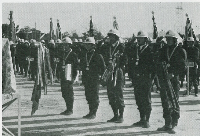
▲ 可搬式ポンプの部優勝の第18分団