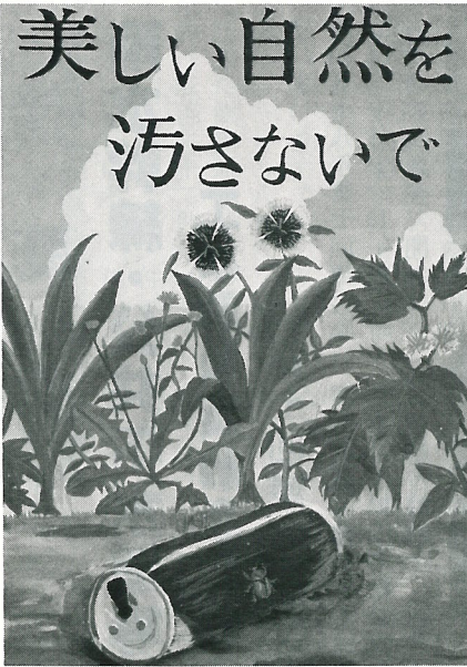
▲ 空き缶散乱防止ポスター コンクール最優秀作品