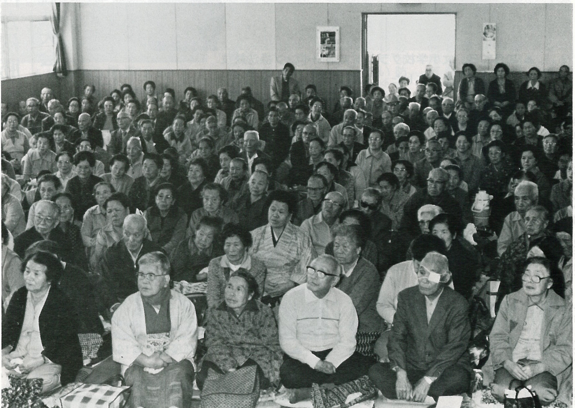
▲ 町内から350名のお年寄りが参加しました。