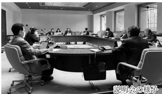
説明会の様子（財政課・福祉課）

内容は、(1) 利根町地域福祉基金条例の一部改正について（財政課・福祉課）、(2) 利根町消防団員の定員、任免、給与、服務に関する条例の一部を改正する条例について（防災危機管理課）、(3) 利根町健康増進等複合施設条例（案）及び利根町総合教育センター条例（案）に係るパブリックコメントについて（政策企画課）、の3件について、執行部から説明があり、議員からは質疑や意見等が出されました。