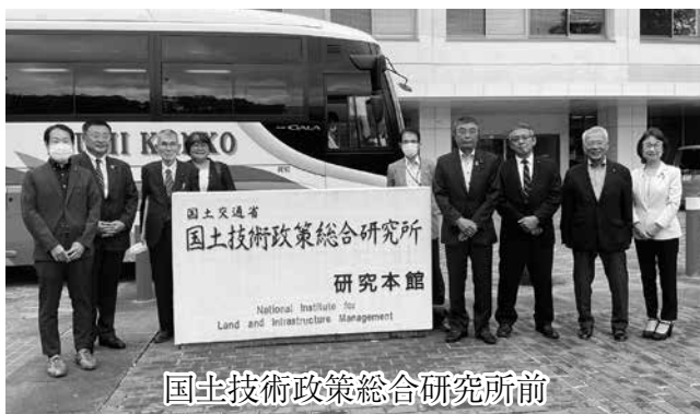
国土技術政策総合研究所前

視察内容は、土砂・洪水氾濫などの土砂水利に関する大規模実験を行う河川模型実験施設、地滑り災害に対してCIMモデルを用いた遠隔技術指導を行う対応拠点、自律施工の技術開発促進に向けた取組を行う建設DXフィールド、トンネルの換気・照明・防災施設実験や老朽化対策の技術検証を行う実大トンネル、最大傾斜角27°のカーブを持ち、道路技術基準確立に必要なデータを得る試験走路などについて説明を受けました。