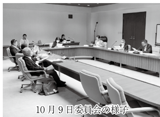
10月9日委員会の様子