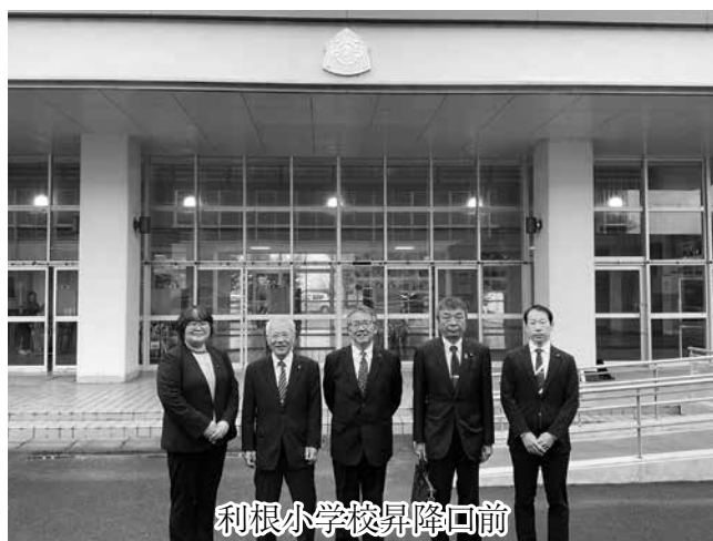
利根小学校昇降口前