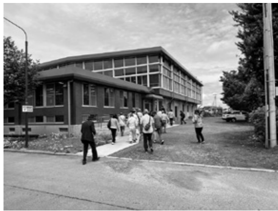
牛久第三中学校 (体育館)