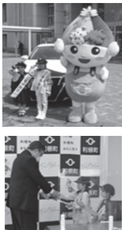
昨年の一日署長さん