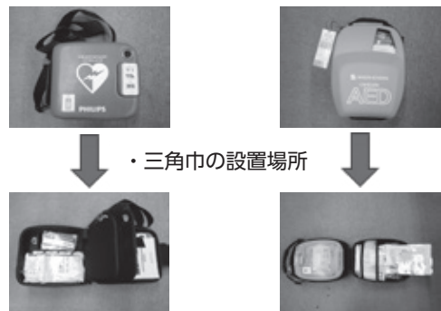
赤色のAEDは、内ぶたに三角巾が入っています。 オレンジ色のAEDは内ぶたに三角巾が入っています。

また、プライバシー保護のためだけでなく、止血や固定など必要に応じて三角巾を使用してください。