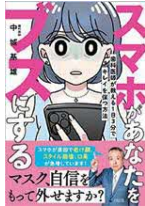
スマホがあなたをブスにする 中城基雄 [著] 大和出版

幼くして安倍晴明の弟子となり卓抜な能力を身に着けた香子=紫式部。親政の回復と荘園整理を目指し、4人の娘を4代天皇の中宮とし、皇子を天皇に据えて権勢を極める藤原道長と繰り広げられる宿縁の確執を描く長編小説。