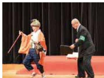
前半は爆笑ステージで大笑い

4月9日(日)、利根町文化センターにおいて、利根町交通安全「懐かしの昭和歌謡ショー(主催：株式会社丸利根アベックス)」が開催されました。第二部では人気上昇中の東京大衆歌謡楽団が登場。満員のお客様には懐かしの昭和歌謡をたっぷりお楽しみいただきました。