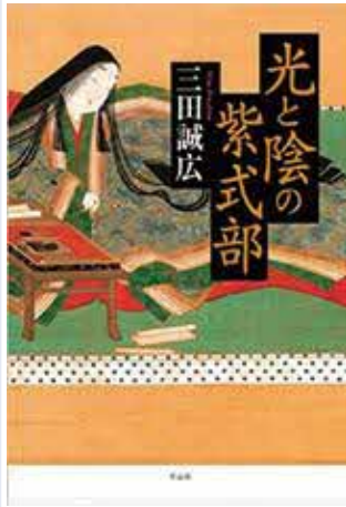
光と陰の紫式部 三田誠広 [著] 作品社

幼くして安倍晴明の弟子となり卓抜な能力を身に着けた香子=紫式部。親政の回復と荘園整理を目指し、4人の娘を4代天皇の中宮とし、皇子を天皇に据えて権勢を極める藤原道長と繰り広げられる宿縁の確執を描く長編小説。