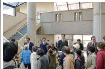
アンコールにも応えてくれた東京大衆歌謡楽団。お帰りのお客さんを出口でお見送り。