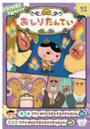
アニメコミック おしりたんてい 15 ポプラ社

ふうちゃんの遠足の日なのに、お父さんもお母さんも寝坊。それなら、自分たちでお弁当を作ろうと、台所で食べ物や道具たちが大はりきり。だけど気づけば「おたまがおったまげたー」なんて、だじゃれ合戦が始まって・・・。