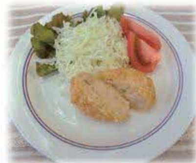
地産地消レシピ 大豆コロッケ