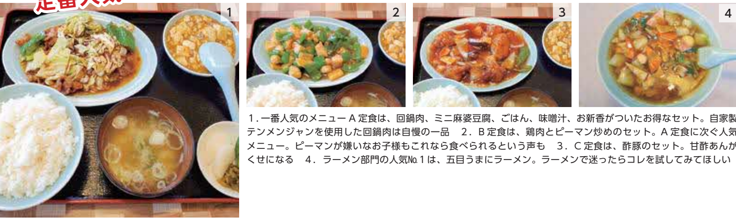
1. 一番人気のメニュー A 定食は、回鍋肉、ミニ麻婆豆腐、ごはん、味噌汁、お新香がついたお得なセット。自家製テンメンジャンを使用した回鍋肉は自慢の一品 2. B 定食は、鶏肉とピーマン炒めのセット。A 定食に次ぐ人気メニュー。ピーマンが嫌いなお子様もこれなら食べられるという声も 3. C 定食は、酢豚のセット。甘酢あんがかせになる 4. ラーメン部門の人気No.1は、五目うまにラーメン。ラーメンで迷ったらコレを試してほしい