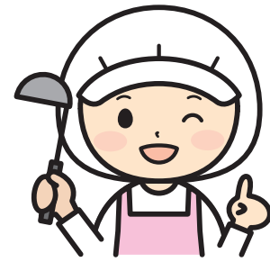
利根町ヘルスマイトが、ピンクのエプロンやTシャツを着用し町内で食育活動を推進しています！

食育とは、『食』に関する知識と、『食』を選択する力を得ることで、健全な食生活を実践できることが出来る人間を育てることです。