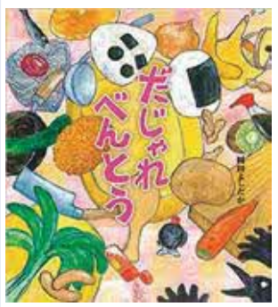
だじゃれべんとう 岡田よしか [著] 佼成出版社

スマホが原因の老け顔、スタイル崩壊、口臭が急増している！具体的な数値を示しながらその理由を解説し、「唾液腺マッサージ」「頭と肩の疲れをとるツボ押し」といった解決法を紹介。