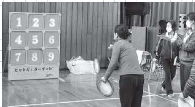
ニューススポーツ大会の様子