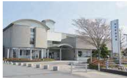
利根町図書館カレンダー

▶問い合わせ先 利根町図書館 ☎68-8868 https://ilisod006.apsel.jp/tonel-lib/