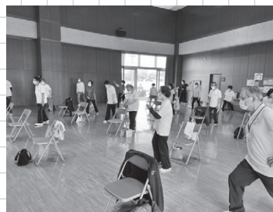
利根町生涯学習センターでの運動集会の様子

「天高く・肥ゆる秋」 やっぱフリフリ 秋は空気が澄み、雲も高く爽やかな季節。一方、実りの季節でもあります。ついつい気持ちよく、食も進みます。(これって私だけ?) こんな時、やっぱり「フリフリグッパ―体操」をお勧めします。 食事・睡眠・運動をバランスよくとることは、私たちの「免疫力を高める」と言われています。 不足ぎみの運動を補う意味でフリフリに挑戦してはいかがですか。 いつでも、どこでも、一人でも、爽快感を高め、脳活動が高まります。仲間と取り組めば、さらなる効果が期待できます。