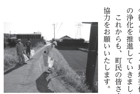
猛暑の中、ご協力いただきありがとうございました これからも、町民の皆さま一人一人のご協力をお願いいたします。