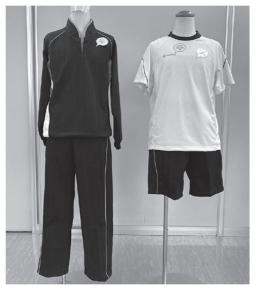
利根小学校のジャージ・体操服

ジャージ・体操服については、町内小学校児童および未就学のお子様がいるご家庭、小学校教職員を対象にアンケートを実施いたしました。 利根町文化センター、利根町生涯学習センター、利根町役場で展示会を開催し、多くの方にご来場いただきました。