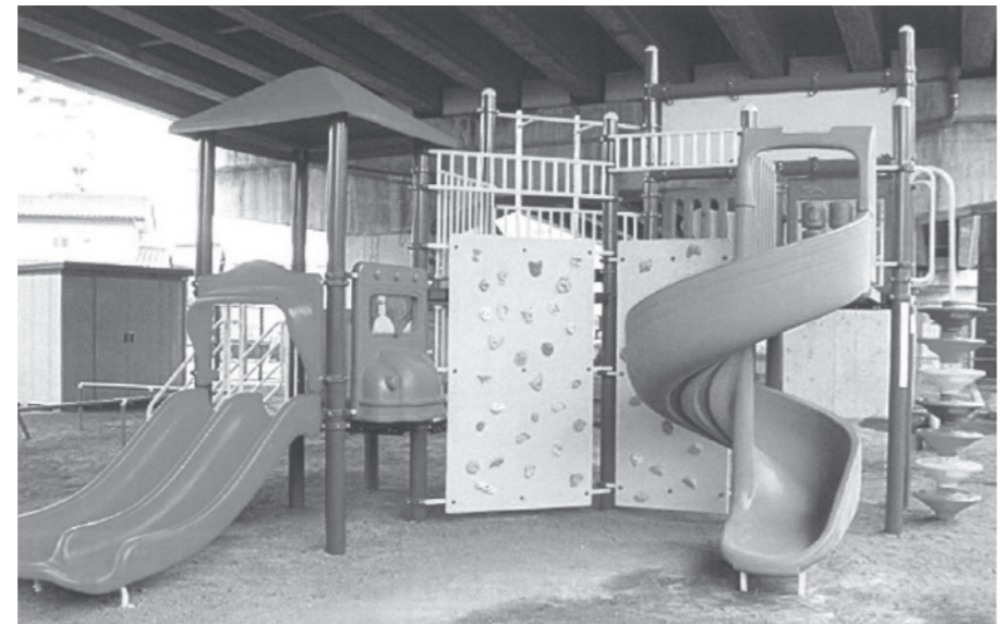
利根小学校に設置予定の複合遊具

利根小学校に設置する遊具については、学校のグラウンドにシンボルとなるような大型の遊具を設置する予定です。 このことについて、町内小学校児童および教職員を対象にアンケート調査を実施いたしました。 アンケートの結果、全360票のうち155票と最も多かった遊具に決定いたしました。 この遊具は、2種類のすべり台やクライミングウォールなどが合わさった複合遊具となっています。楽しく遊べるだけでなく、しっかりと運動もできるような遊具となっています。