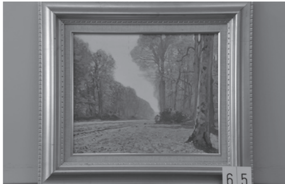
バ・プレオ街道 モネ