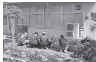
青空の下、せっせと植え付けを行う有志たち