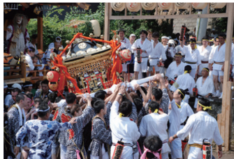
平成30年に開催された布川神社臨時大祭の様子