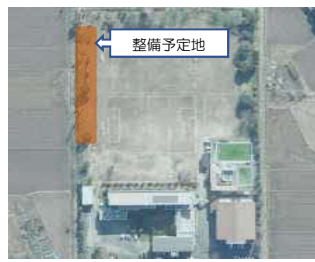
駐車場整備予定地(校庭東側)