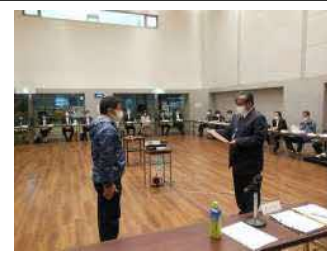
委嘱状の交付(第一回会議)