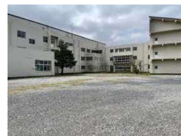
バスロータリー整備予定地(校舎裏側)

令和5年4月の開校に向け、令和3年第1回利根町議会定例会に、令和3年度利根町一般会計予算「小学校統合事業」として、統合準備委員会の運営経費(委員謝金、共済保険料)、新しい校章及び校歌の制作経費、校舎北側の給食室裏に整備する児童が通学に利用するスクールバスのバスロータリーや、校庭東側に整備する保護者等の駐車場の整備に係る工事費、校舎に新設する身体が不自由な方や高齢者等のためのエレベーター及び多目的トイレの設置に必要な設計業務委託費等を提案し、可決されたことにより、令和3年度の小学校統合事業関連予算が次のとおり決定しました。