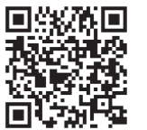
▲土砂災害警戒情報