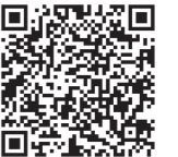
▲土砂災害ハザードマップ

【メモ】「土砂災害警戒区域」とは、茨城県が指定基準をもとに、土砂災害のおそれがある区域を指定しています。