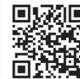
▲ iOS 端末はこちら