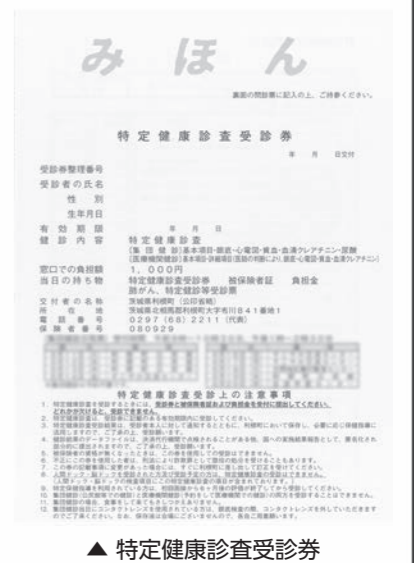
▲ 特定健康診査受診券