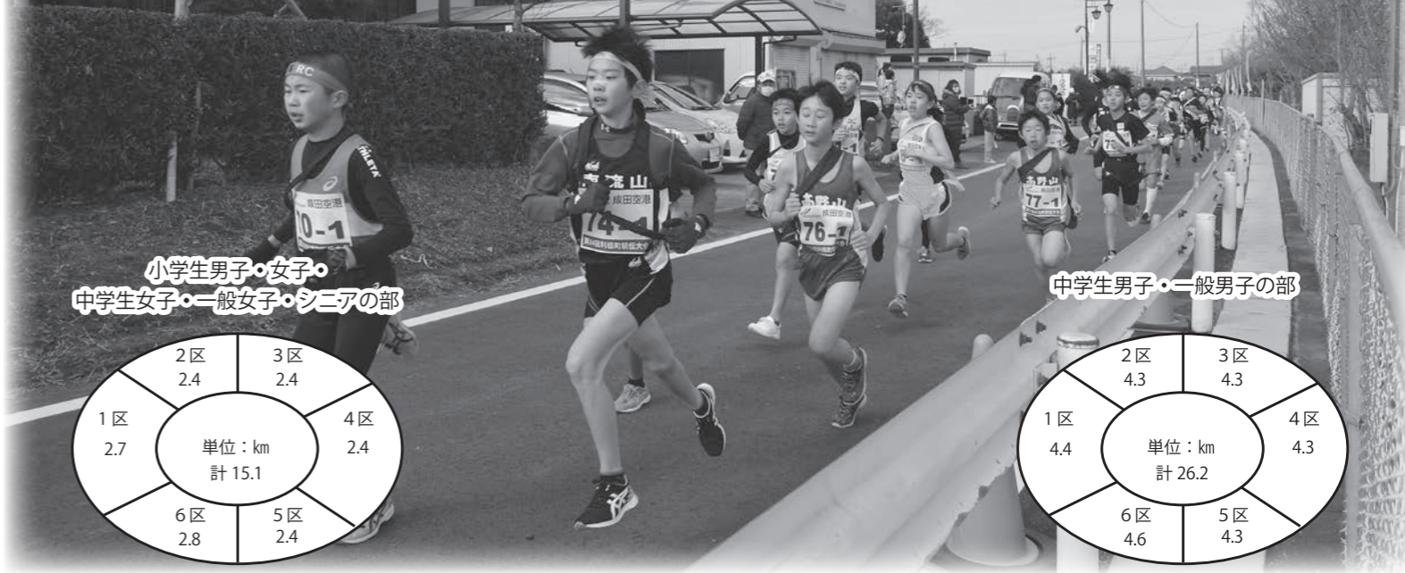
小学生男子・女子・ 中学生女子・一般女子・シニアの部