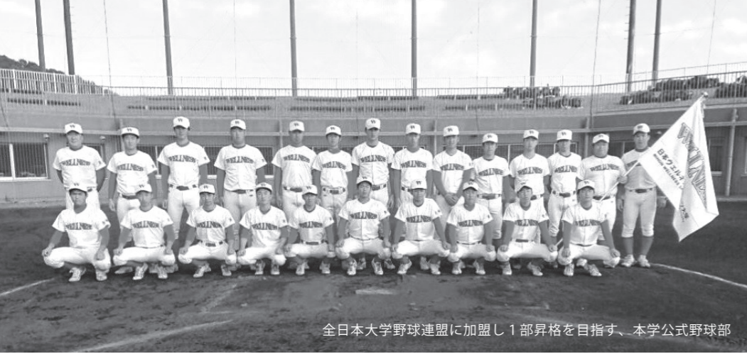
全日本大学野球連盟に加盟し1部昇格を目指す、本学公式野球部

新年あけましておめでとうございます。本年も、日本ウェルネススポーツ大学をよろしくお願いたします。