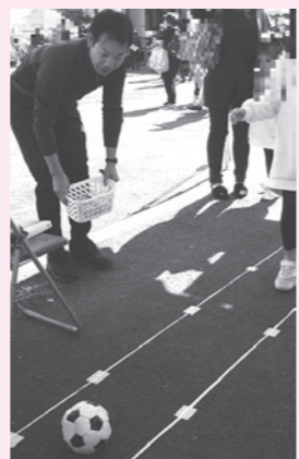
地場産業フェスティバルにて UFO フリーボール体験会実施

地域おこし協力隊の活動では、インターネットを活用して、利根町の魅力発信などを行って来ましたが、私は、利根町の一番の宝は町民の皆さまだと思っています。 退任する理由は、その宝である利根町で活躍されている方たちを町内外にもっと伝えたいということ、何かに挑戦したい、やりたいことがあるのに出来ない、という方たちを自由な立場でサポートして行きたいと思ったからです。 私は卒業しても利根町に住み続けたい。違った形で地域おこしに貢献していきたいと願い、前に進むための卒業(退任)です。 これから、町で見かけた時、声をかけていただけたら嬉しいです。今までどうもありがとうございました。