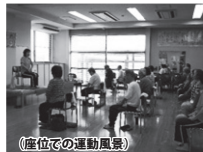
（座位での運動風景）