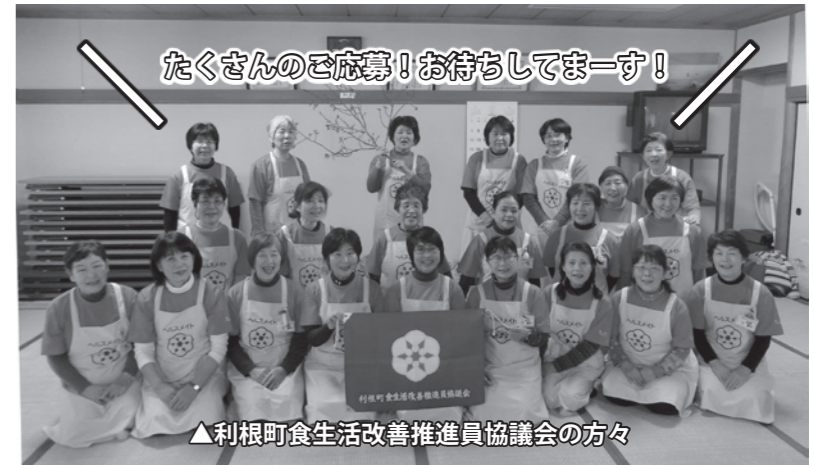
△利根町食生活改善推進員協議会の方々