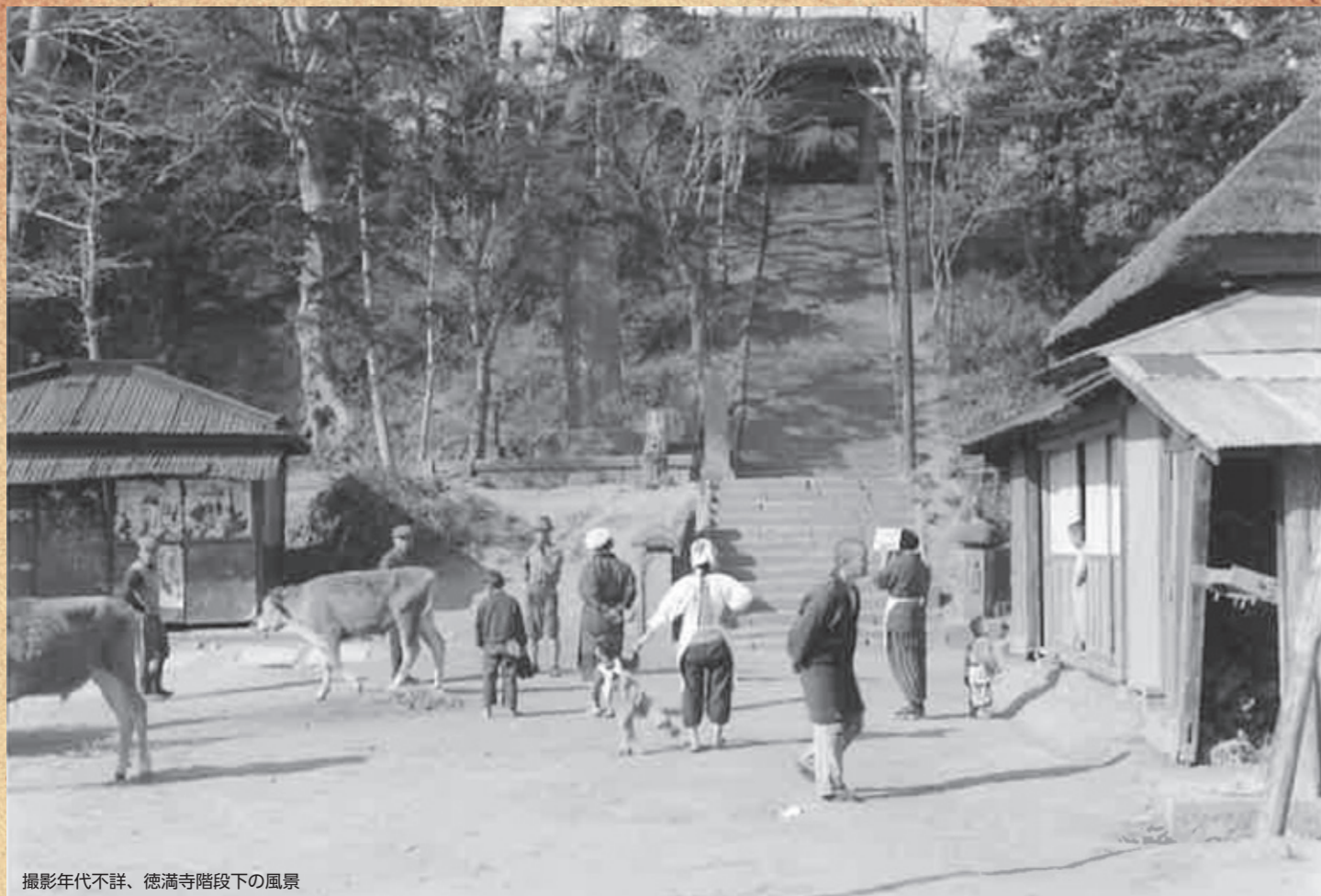
撮影年代不詳、徳満寺階段下の風景