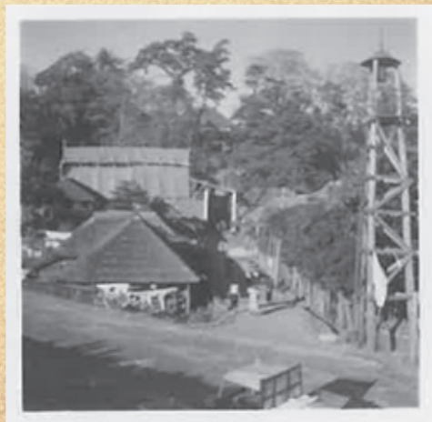
撮影年代不詳、土手側から徳満寺階段方面を撮影したと思われる写真