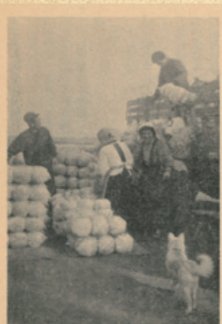
昭和40年3月発行の広報とねより、キャベツの共同出荷の風景

古き良き時代。みなさんはいつの時代のどんな風景を思い描きますか？ 今ほど物や情報があふれていなかった時代。それでも、思い出すと懐かしく、 心が温くなる風景が、心の中にあるのではないのでしょうか。 利根町の風景も、時代の変化とともに大きく変わり、現在に至ります。その変化を知る ことは、町の未来を考える上でも、とても大切なこと。 昔の利根町の姿を少しずつ繋ぎ合わせて、未来に残していく。 町の宝物を集めるような、そんなプロジェクトがスタートしました。