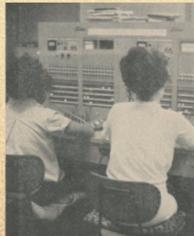
昭和41年10月発行の広報とねより、有線放送交換室と交換手