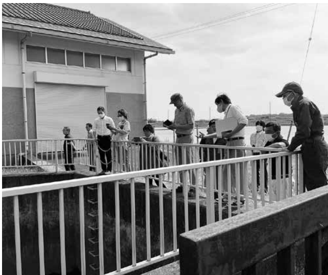
立木排水機場の確認