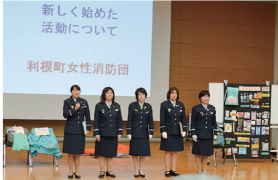
平成30年に茨城県庁で開催された県女性消防団員活性化大会の様子。防火・防災啓発について発表しました

消防団員数が減少している一方で、全国的に女性消防団員数は年々増加しています。それぞれの地域の実情に応じて、消防団本部付けの採用とされたり、各地域を管轄する分団に所属したり、女性のみで組織する分団に所属したり、活躍の形態はさまざまです。 利根町消防団では、本部付けの女性消防団員所属が5名、分団の所属が1名、計6名の女性消防団員が活躍しています。