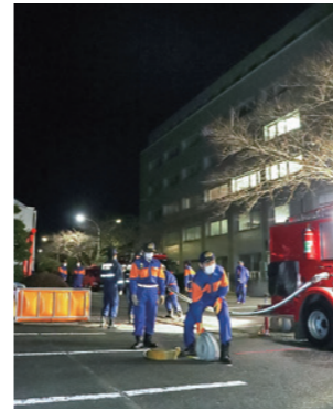
水出し操法訓練の様子。消防隊員の方も立ち合い、手順をしっかりと確認

活動を維持するための課題 消防団は地域の防災に欠かせない存在ですが、活動を維持する為には課題があります。 一つは団員数の減少と高齢化です。平成24年の町の消防団員数は197人でしたが、今年までに26人減少しました。年代別の割合では、30歳代以下の割合が少なくなり、40歳代以上の割合が増えています。 もう一つは、消防団を取り巻く社会環境の変化です。かつては自営業や農業を職業とする団員が中心でしたが、今は会社員などの被雇用者が増加。町外で働く人も増え、勤務中に火災や災害が起きても職場を抜けられず、現場に駆け付けられないという人が多い現実もあります。 内閣府が平成24年に行ったアンケートでは、消防団に「入らない」と答えた人が72・6%もいました。理由は「体力に自信がない」「高齢である」「職業と両立しそえない」の順で多く、「職業と両立しそえない」と答えた人の割合は29・6%を占めました。